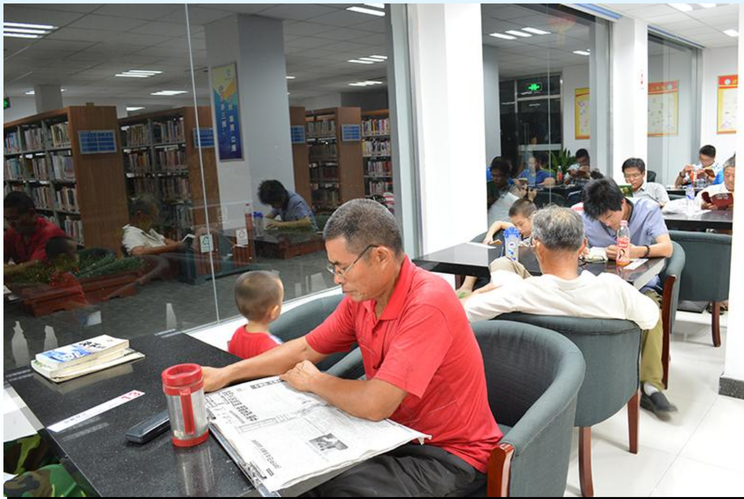
村民在永联图书馆看书