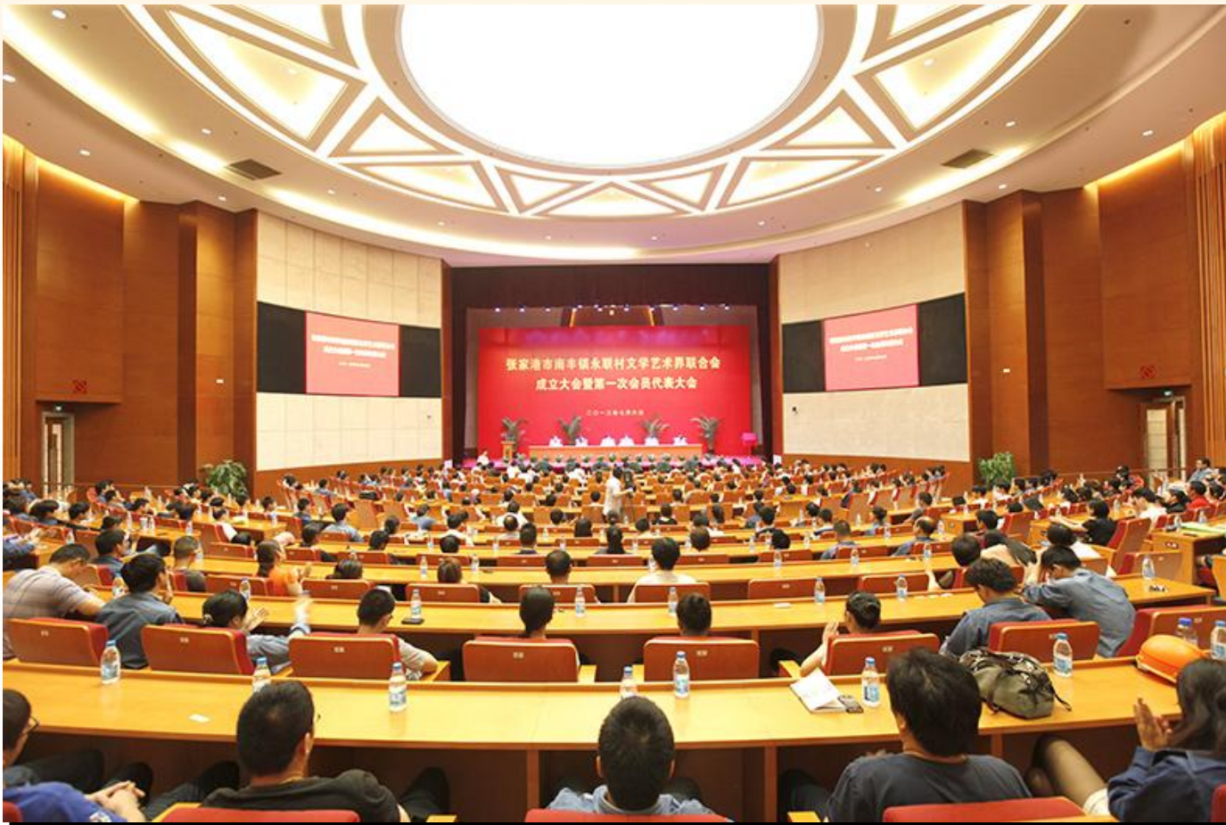
永联村成立苏州市首家村级文联，图为成立大会