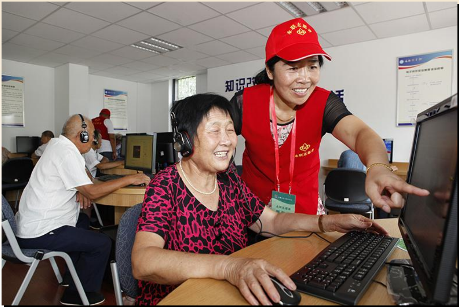
在永联图书馆电子阅览室组织志愿者给老年人进行电脑知识培训