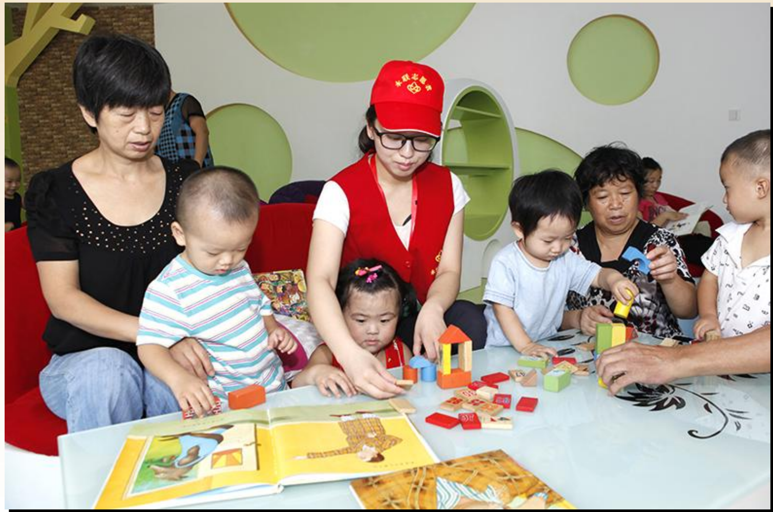
志愿者们还当起孩子们的英语辅导老师