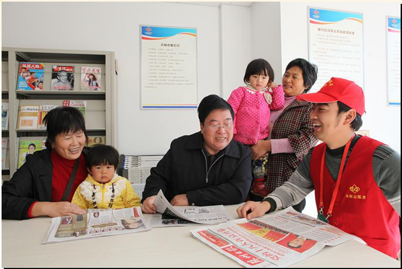
志愿者为老年人读报