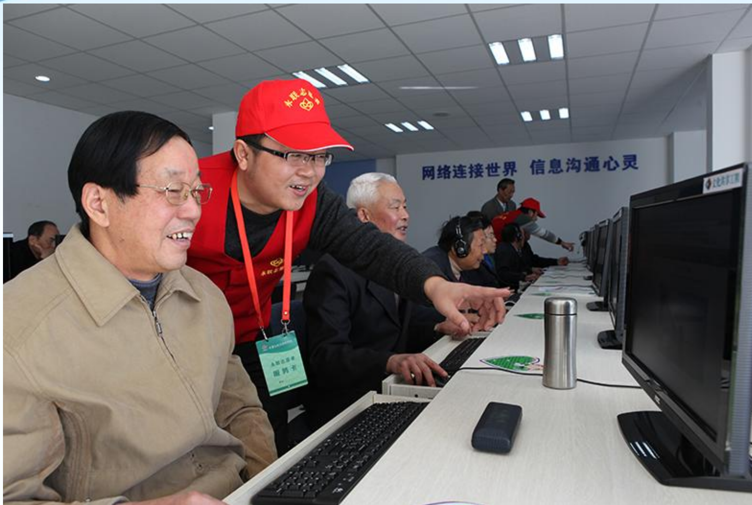
读者在网上查询市图书馆的书目信息