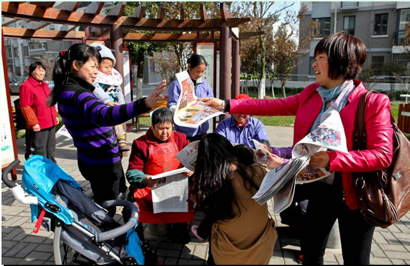
《永联村讯》每月定期发到村民家中