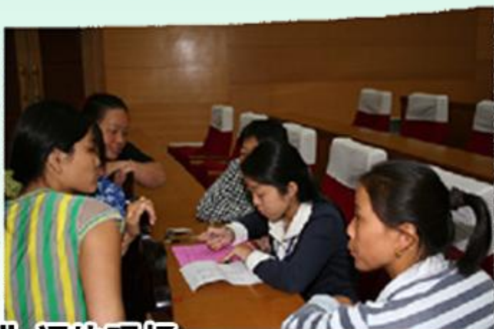
“文明家庭奖”评比现场