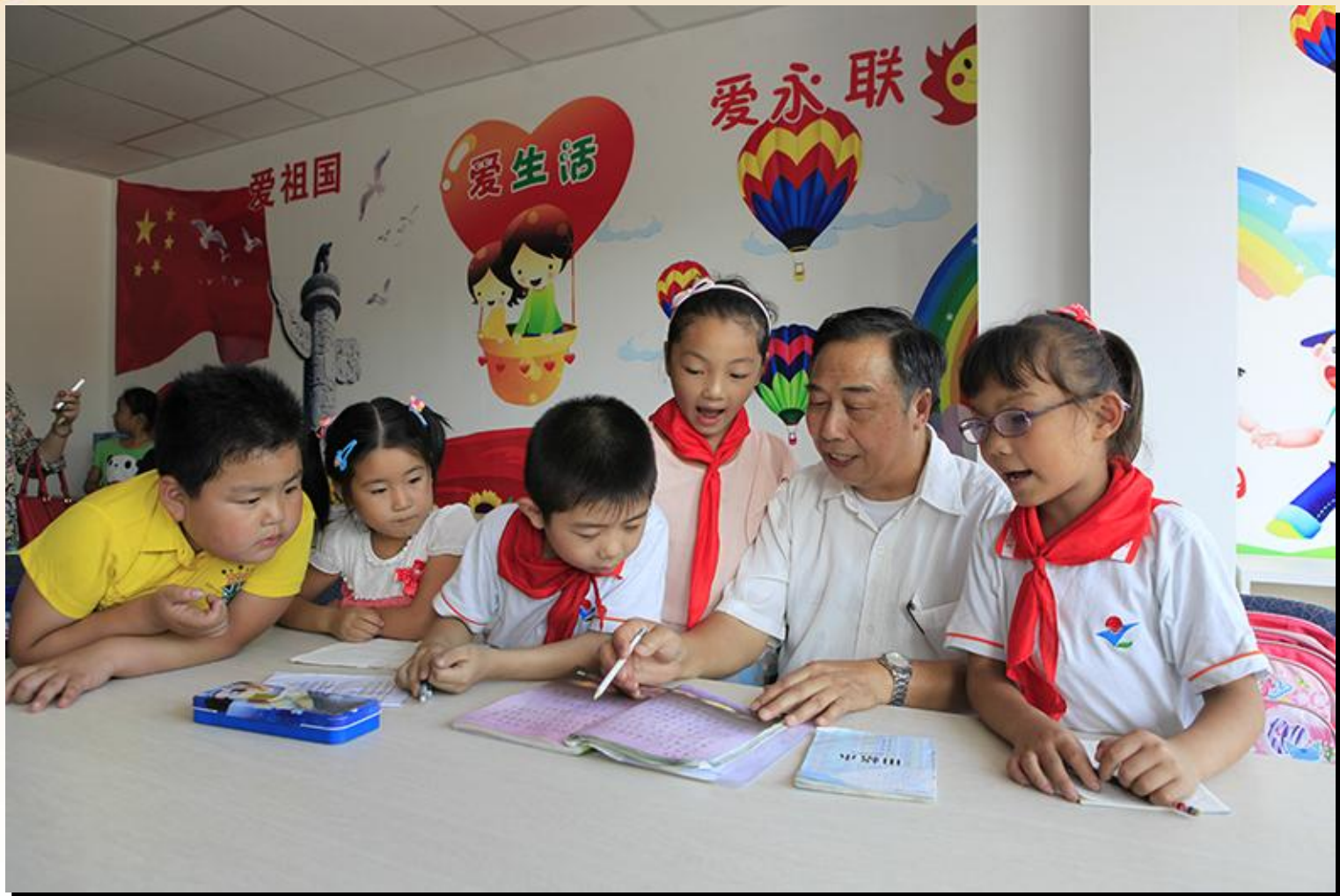
志愿者为学生们辅导作业