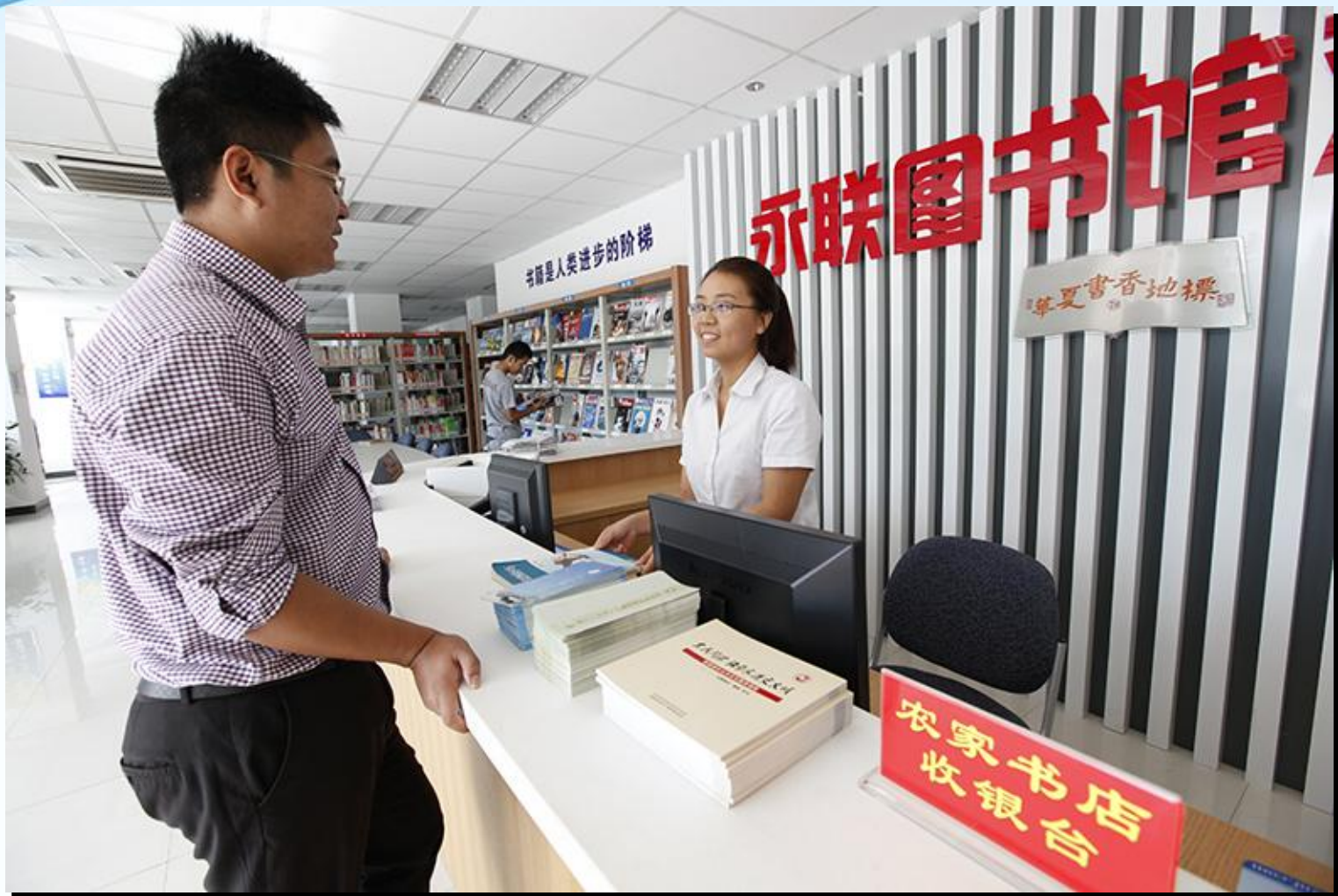
图书馆工作人员与读者交流