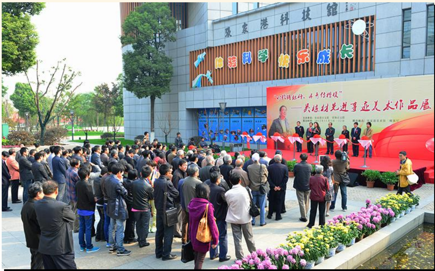
吴栋材先进事迹美术作品展