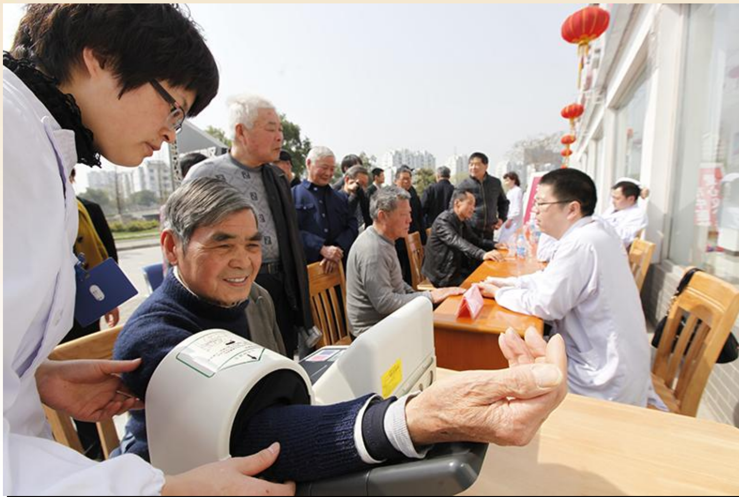
邀请市中医院专家为群众现场讲授医学小常识和义诊