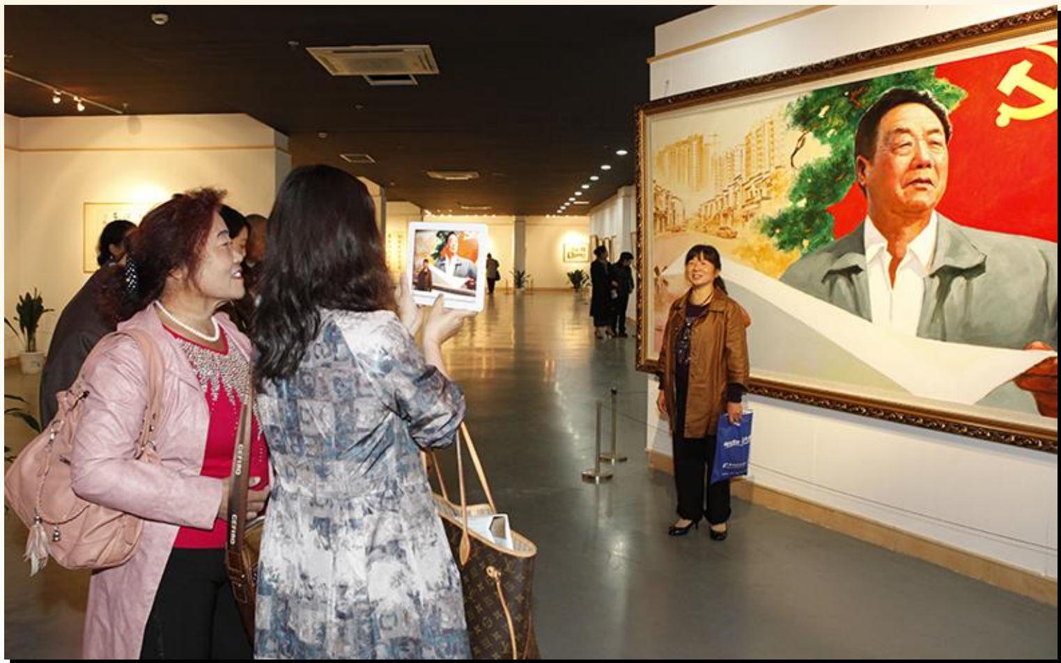
组织村民和职工前往观摩学习