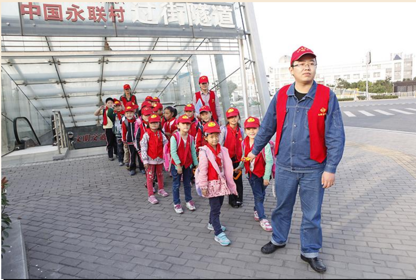
志愿者们接孩子放学