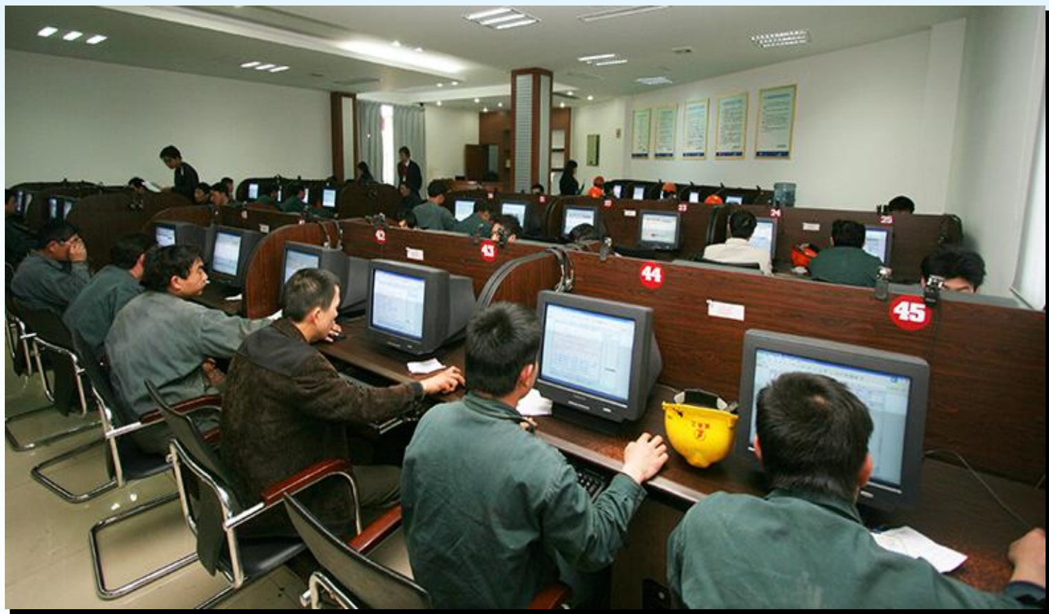
图书馆电子阅览室与市图书馆建立电子图书共享平台