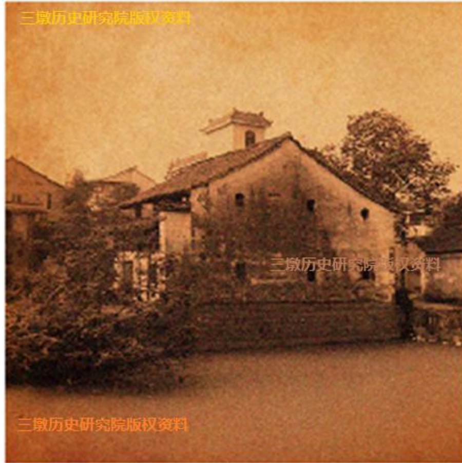
三墩文昌阁裙楼复原图